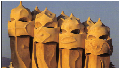
Gaudi, La Pedrera, Barcelona