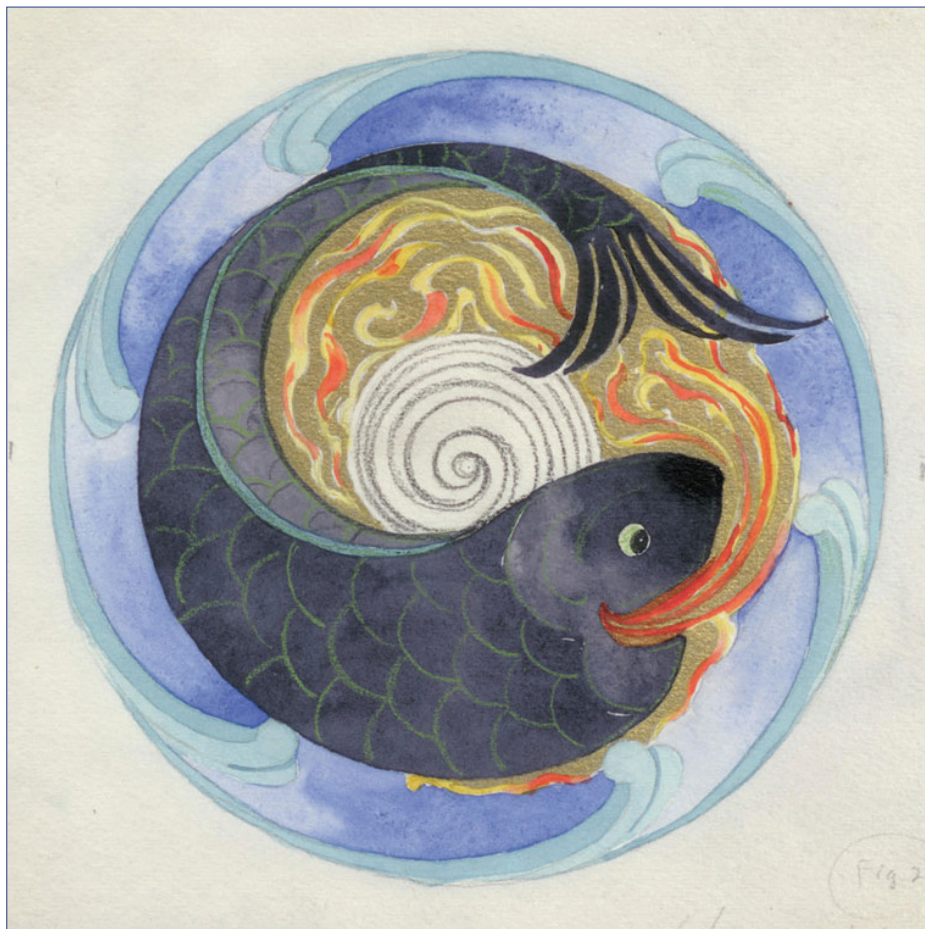
Mandala, malet af en af Jungs patienter

1-årigt grundkursus i Analytisk Psykologi Baseret på Jungiansk teori og praksis