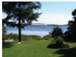
Villa Fjordhøjs have