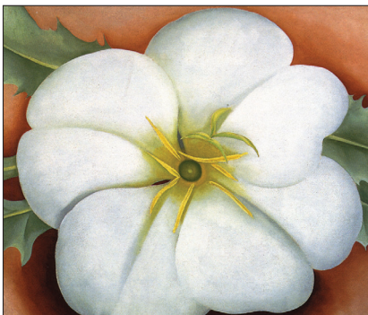
O'Keefe: White Flower on Red Earth