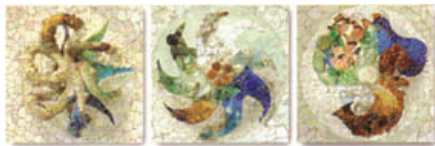
Mosaikker af Gaudi