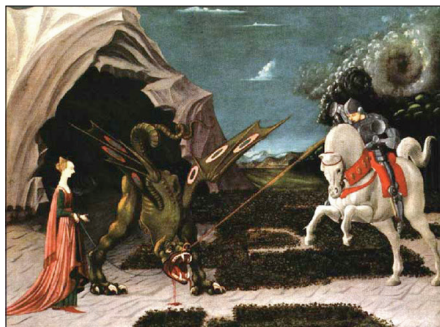
Uccello: St. Georg og dragen